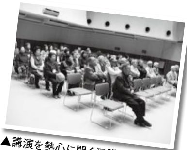
▲講演を熱心に聞く受講生