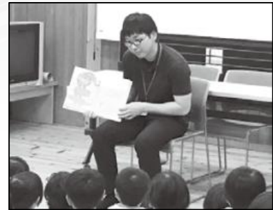
昨年のおはなし会の様子

毎年好評の「読みメンおはなし会」を今年も開催します。 どなたでも参加いただけますので、ぜひお越しください。