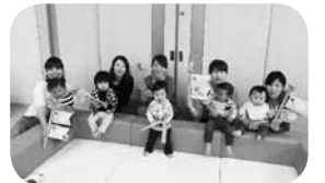
みんなでハイポーズ!!