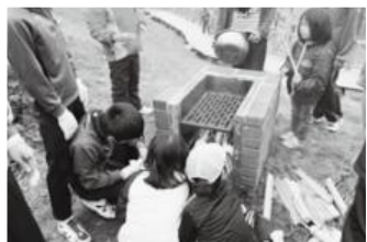
▲苦勞して薪に火をつけました。

今回の全校遠足は、準備から計画、進行まで上級生が中心となって活動するという本校の特長が生かされた行事になりました。本年度も小中一貫校の特長を生かした取り組みを継続してまいりますので、今後ともご理解、ご協力をお願いします。