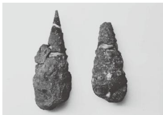
▲ピカリアの化石（巻米より発見）

若桜町内に分布する岩石の一種「三郡変成岩」は、古生代から中生代（5億4千万～6千6百万年前の間）に形成された地層で、兵庫県西部から九州北部に広く分布し、福岡県の三郡山から名前が付けられています。県内の三郡変成岩はほとんどが火山岩類に覆われており、県内で露出した状態で確認できるのは若桜町を含めた八頭郡内と日南町のみとなっています。以前は県内最古の岩石と言われていましたが、その後の研究でさらに古い岩石（片麻岩）が県西部で発見されています。