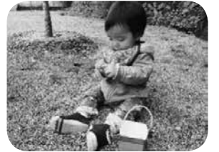
たんぼぼみ〜つけた！