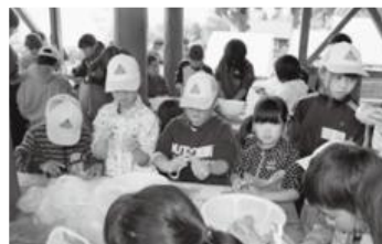
▲みんなで協力してがんばりました。