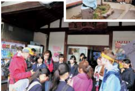
▲まちなみ散策の様子

鳥取県と交流している米国バーモント州の高校生と環境交流団体が構成された青少年交流団の12名が鳥取東高校の生徒とともに若桜町を訪れました。