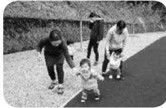
1 2、1 2 たくさんあるいたよ