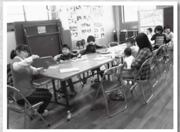
▲絵本 しろくまちゃんのほっとけーき

親子のコミュニケーションが自然にできる読み聞かせは、親子の絆を深め、将来にわたって本好きの子どもに育て行く機会の提供の場として、親子で楽しめる様々な内容を行っていききたいと思います。