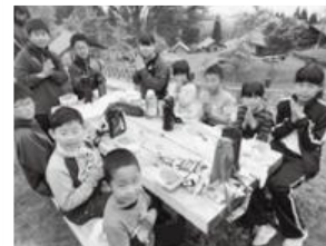
▲班でそろって「いただきます」