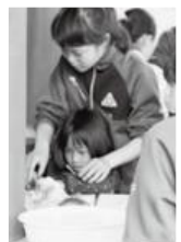
▲中学生のお姉さんと一緒にしました。