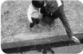
あそこにアメンボがいるよ