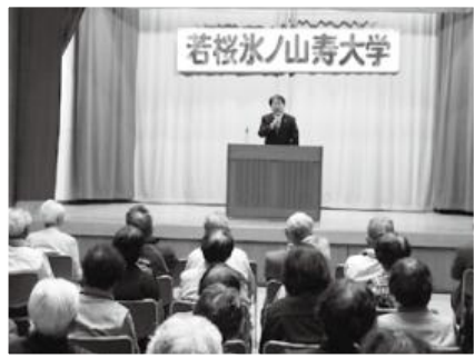
▲講演する矢部町長