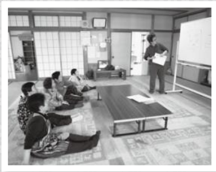
▲瞬間記憶力ゲーム

皆さんの様々な体験話を聞かせて頂き、「昔はそうだった。そうだった。」と笑いながら自分の存在価値を確かめました。認知症の予防や、症状の進行を遅らせるために、何かを一生懸命考えるのは、とても良い頭の刺激になりました。