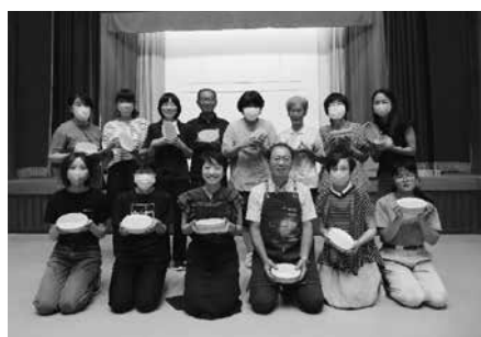
▲完成した曲げわっぱを手に、皆さん素敵な笑顔

は熱心に手を動かしていました。完成した弁当箱を手に、参加者の皆さんの表情には達成感と喜びがあふれていました。「自分で作ったお弁当箱に、おかずを詰めるのが楽しみです！」「杉板を折らずに曲がってびっくりした！」「弁当箱の蓋を無心で削ったのがとても楽しかった！」といった声も聞かれ、温かいぬくもりのある時間を過ごすことができました。今後、木工体験の機会を積極的に設けていきたいと考えておりますので、ぜひご期待ください。