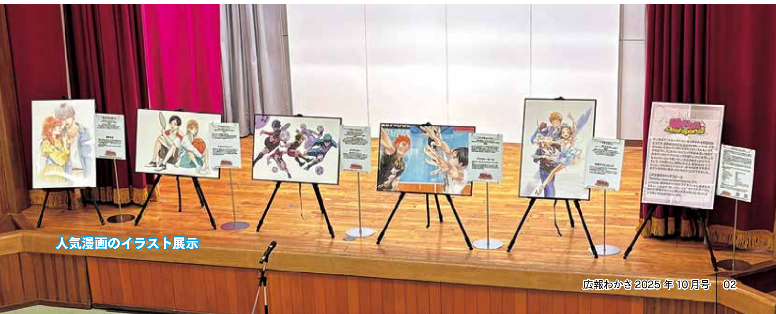
人気漫画のイラスト展示