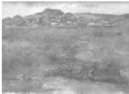
▲「シチ山に見える風景」 ※若桜小学校に展示されていた作品

皆様のお越しをお待ちしています。 【会場】若桜郷土文化の里 たくみの館(入場無料) 【期間】10月4日(土)～11月16日(日) 9時～17時 【休館日】月曜日(祝祭日の場合、その翌日)