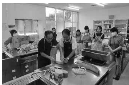
▲完成が待ち遠しいですね！