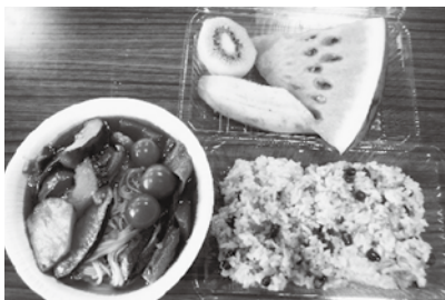
▲野菜たっぷり健康そうめん