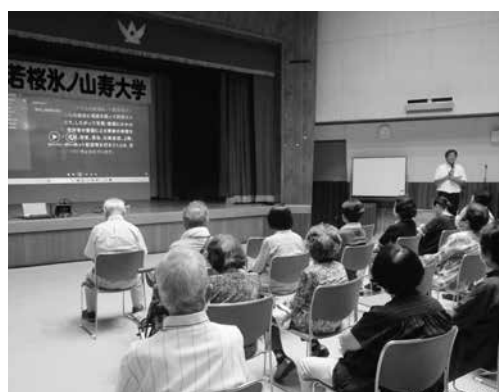
▲映画の上映前のワクワクした雰囲気が伝わってきますね