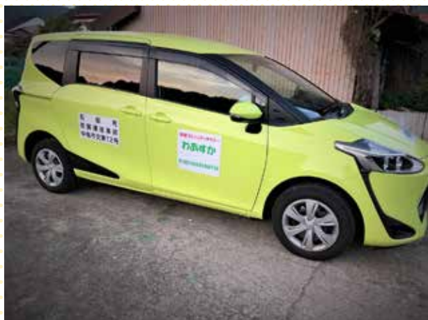
▲共助交通「わあすか」（吉川地区）

町民の皆様が、免許を返納されても、買い物や通院、ちょっとした外出など日常生活を継続できるよう、いつまでも住み続けられる環境づくりに力を入れてまいります。