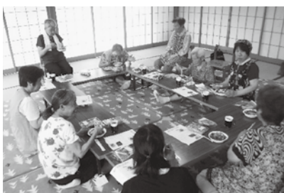
▲美味しくいただきました