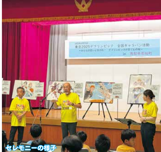
セレモニーの様子