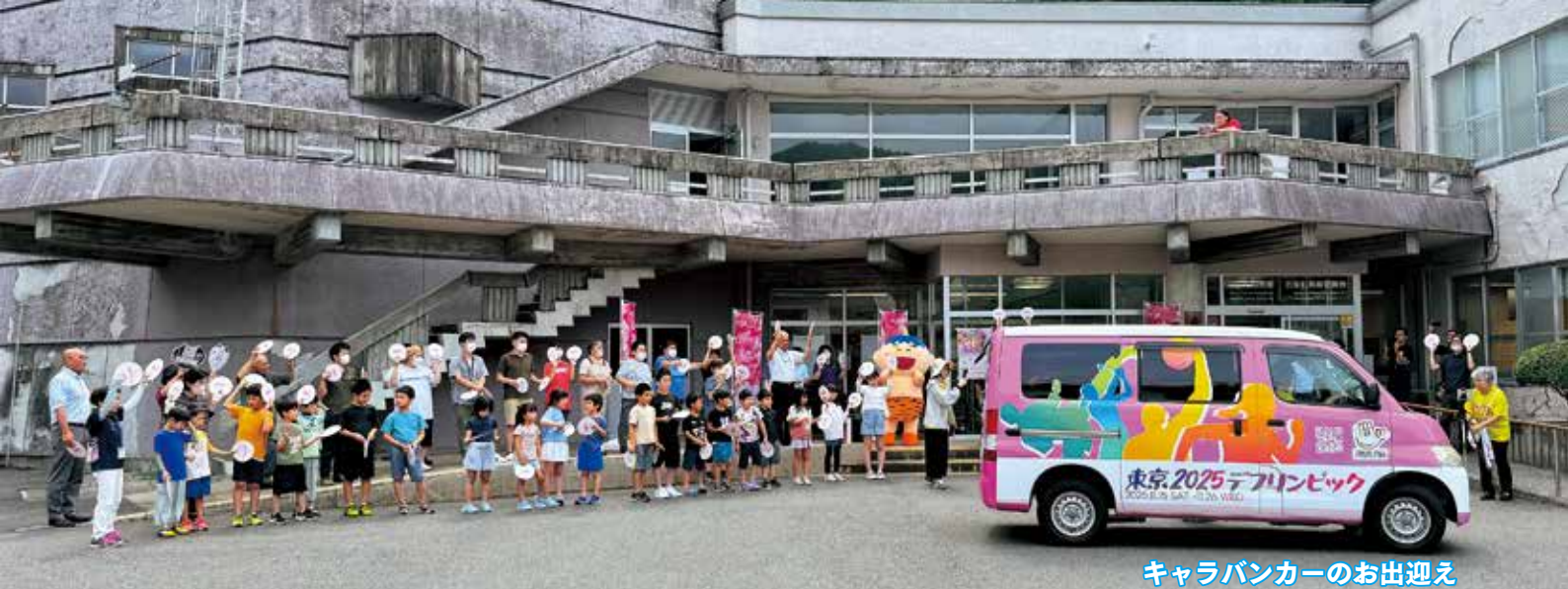
キャラバンカーのお出迎え