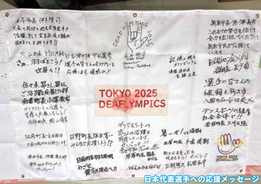
日本代表選手への応援メッセージ