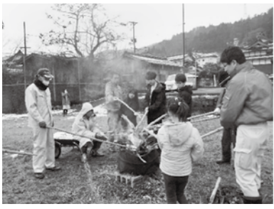
▲竹竿に挟んだお餅をあぶる