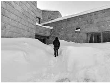
▲雪に覆われた響の森

しかし、冬は外で楽しく過ごす時間が多い反面、事務作業が非常に溜まりやすいので、外から帰ってきたスタッフは、そのあと必死に机にかじりついています。