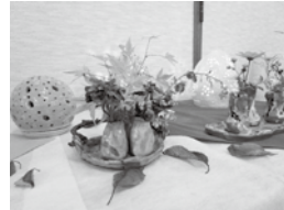
▲若桜町公民館作品

たくみの館では、若葉台地区公民館と若桜町公民館の作品交流展示会を開催します。第11回目となる今回は、若桜公民館から若桜陶芸クラブに協力いただき多種多様な陶芸作品や例年のように刻書、いやし地蔵を展示します。また、若葉台公民館からパッチワークや因州和紙、写真、木工、手芸等の作品を展示します。各サークル・団体の皆さまが作成された素晴らしい作品をぜひご覧ください。