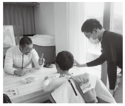
▲人権学習・手話で自己紹介