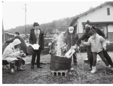
▲字が上手になりますように!