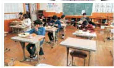
▲イチオシ若桜メシを楽しむ児童たち