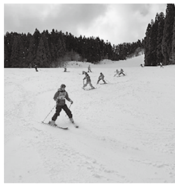
▲午後からの練習の様子