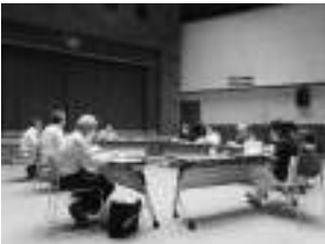
▲「吟翔会」の練習風景

教範テキストを常に携行し、五つの吟詠心得を基本として繰り返し「吟魂」で今後も日々の精進に取り組んでまいりたいと思います。町民の皆さまの教室見学をぜひともお待ちしております。