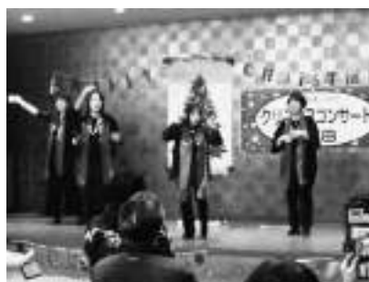
▲リトルバードさん