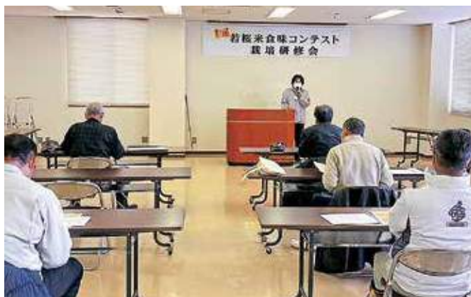
▲栽培研修会の様子