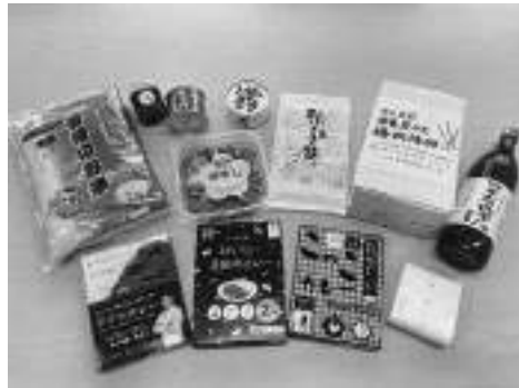
▲3町の特産品セット