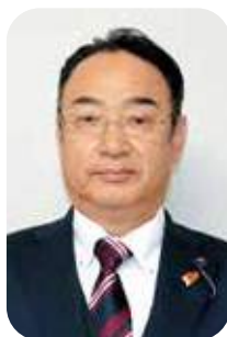
川上 守 議員