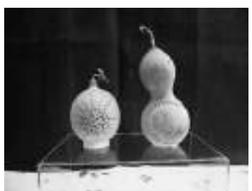
▲若葉台地区公民館作品

たくみの館では、若葉台地区公民館と若葉町公民館の作品交流展示会を開催します。 第10回目となる今回は、手芸やパッチワーク、ひょうたん、はがき絵、俳句等の展示会です。例年のように刻書、いやし地蔵の作品も展示します。各サークル・団体の皆さまが作成された素晴らしい作品をぜひご覧ください。 【会場】 若葉郷土文化の里 たくみの館 (入場無料) 【期間】 3月5日(土)～3月27日(日) 9時～17時(最終日は15時まで) 【休館日】 月曜日 (月曜日が祝祭日の場合、その翌日)