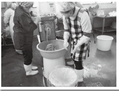
▲材料をミキサーにかけ完成