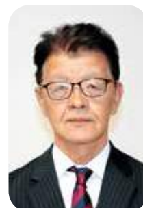
山根 政彦 議員