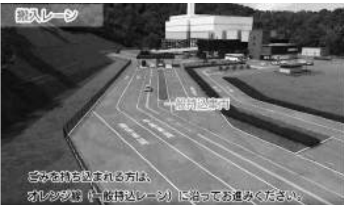
▲施設内へのごみの搬入経路