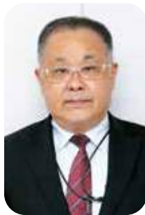
梶原 明 議員