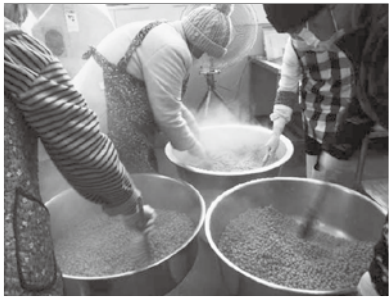
▲蒸した大豆を40度まで冷ます

皆さんが厚着をして参加されていましたが、圧力鍋で茹でた豆を大型扇風機で一定の温度になるまで混ぜながら冷やす作業は、風が冷たくふるえましたが、美味しい味噌のために根気強く作業を行いました。 この日仕込んだ味噌は、10ヶ月ほど熟成させ、秋頃には食べ頃に仕上がる予定です。