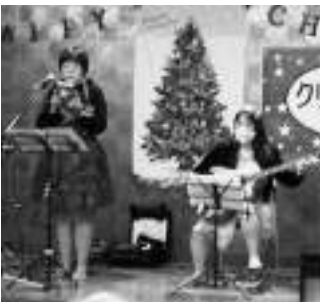
▲LUNA & SUN さん

年明けから世界的にオミクロン株の感染が拡大していますが、いつかきっと、またこんなコンサートが開けることを願っています。