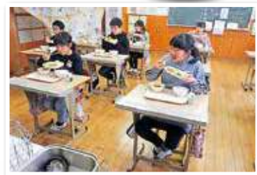
▲ハンバーグは子どもたちに大人気