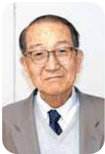
中尾 理明 議員