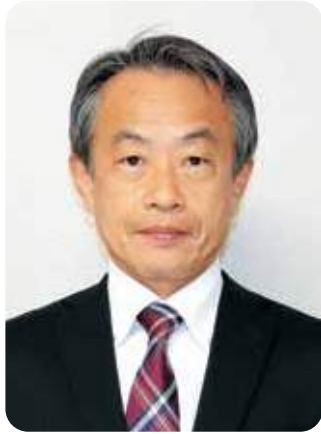
上川 元張 町長