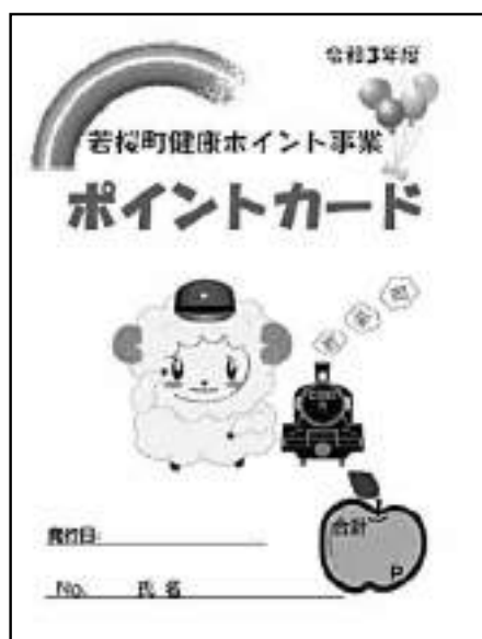
▲健康ポイント事業ポイントカード