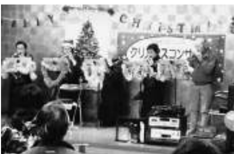
▲おおむらオカリナサークルさん