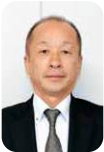
森田 二郎 議員