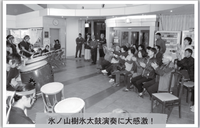
氷ノ山樹氷太鼓演奏に大感激!

この日は、高原の宿氷太くんに宿泊して氷ノ山樹氷太鼓による歓待を受け、翌日は、若桜宿内を散策し、カリヤ通りや昭和おもちゃ館、太田酒造、道の駅を訪れ、古き良き若桜の街の空気を感じてもらいました。