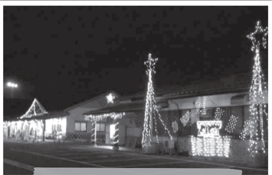
町の拠点を彩るイルミネーション