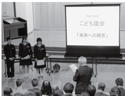
●日時 12月4日(木) ●場所 若桜学園さくらホール