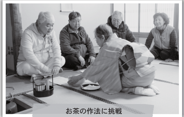
お茶の作法に挑戦