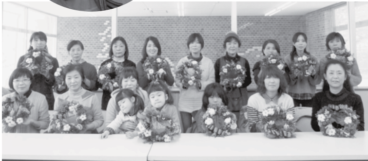
力作が並びました

街の子に米芋重く持たせけり 天高しビルのすき間に松山城 月白の宵をめでつつ帰りけり 冬風や手こぎボートの櫂の音 冬ぬくし笑顔に覗く二本の歯 七五三晴着うれしや日本晴 立冬や足湯に並ぶ老いの膝