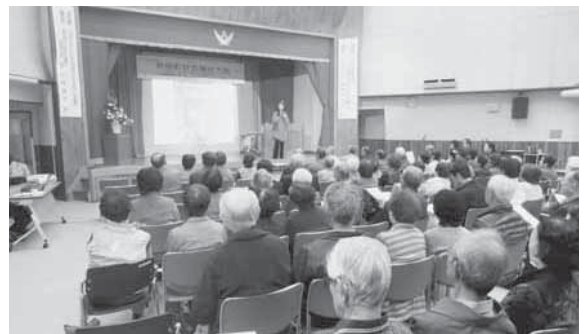
会場を埋め尽くすほどの参加者