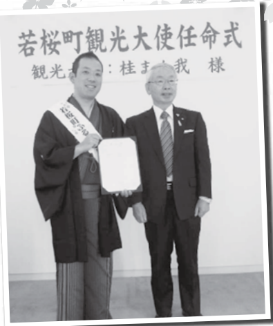
若桜町観光大使任命式 (桂まん我：左、小林町長：右)

桂さんは、兵庫県のご出身ですが小さい頃、若桜町に帰られたときにはよく自然の中で遊んでいたとおっしゃられています。1999年に初舞台を踏まれてから今日まで数々の賞を受賞されており、日々お忙しい毎日をお過ごされています。また、「まん我」という名前と「まんが王国とつとり」との繋がりもあり、鳥取県のふるさと大使としても活躍をされています。