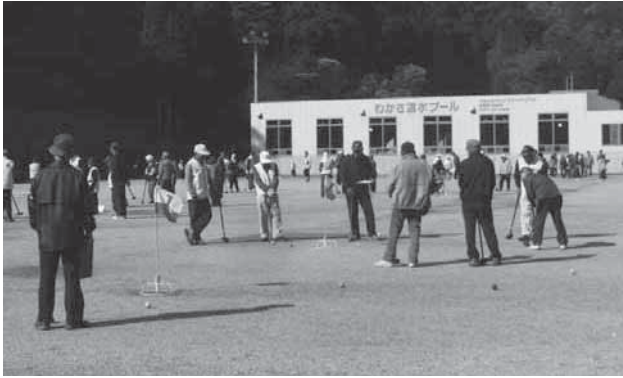
のびのびと爽やかにプレーをする参加者

団体戦・個人戦ともに白熱したゲーム展開となり、熱戦が繰り広げられました。大会結果は下記のとおりです。