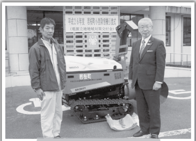
三倉集落へ配備される小型除雪機

安全には十分気をつけて運転していただくとともに、集落で大切に使用していただきたいと思ひます。