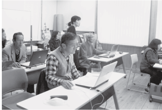
「Word・Excelを使いこなそう」の教室

「はじめてのパソコン」では、「パソコンに初めて触った」「パソコンを持っているが使い方がよくわからない」という方々の参加でしたが、「思い切って参加してみてよかった」という言葉をいただきました。この教室が今後役立つことを期待します。