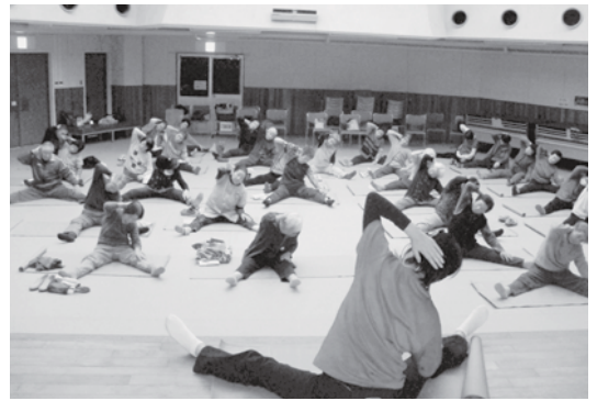
講師からストレッチを教わる受講生

タオルを使った肩こり予防運動や手先を使った頭の体操、関節を伸ばすストレッチ運動などを行い、笑いもありの和やかな雰囲気の中で、受講生は楽しみながら体を動かしていました。