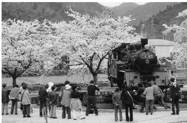
お花見列車に乗って来場し、SL見学する観光客

今年度は4月に「桜まつり」や「お花見列車」の運行、7月から9月までは「風鈴列車」を運行します。各家庭に風鈴がござい