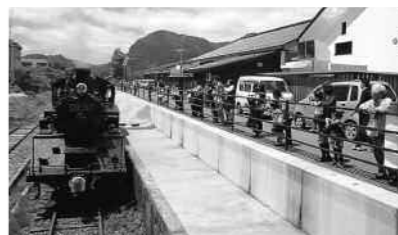
SL乗車体験を見学する観光客ら

6月1日に2周年を迎えた道の駅「桜ん坊」では、5月29日・30日、2周年を記念して「物産市」を開催しました。 地元からも多くの出店者が集まった会場では、若桜町の旬な食材や特産品などの販売が行われ、訪れる買い物客にまちの魅力がPRされました。 同会場裏のプラットホームで行われた蒸気機関車乗車体験や機関士の制服を着ての記念撮影会には、たくさんの方が列をつくり、汽笛が鳴るたびに歓声があがっていました。