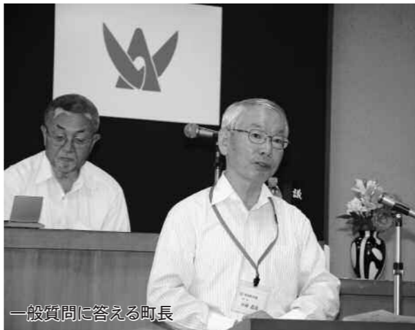
一般質問に答える町長