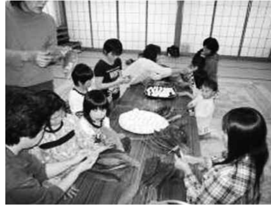
上手に巻けるかな

たくましくはばたく力育成事業の一つとして、「読みきかせ教室」を開催しています。5月28日は、保育所の保育士さんと一緒にささ巻きづくりに挑戦しました。