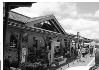
買い物客でにぎわう桜ん坊