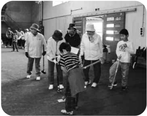
はじめてグラウンドゴルフ

この日はあいにく雨模様となり、屋内運動場での開催となりましたが、運動場いっぱいには歓声が響き渡っていました。