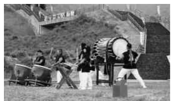
わかさ氷ノ山樹氷太鼓の勇壮な演奏に送られて

6月12日、13日の両日、わかさ氷ノ山自然ふれあいの里活性化協議会は、氷ノ山の夏山シーズンの安全を祈願し、わかさ氷ノ山夏山開きイベントを開催しました。 あいにくの雨模様と強めの風の影響により、山頂での安全祈願祭は避難小屋の中で行いました。入山を心待ちにしていた県内外の登山者約300名が山頂を目指しながら、ブナの自然林やトチノキの巨木、神秘的な樹林帯を満喫しました。 入山を心待ちにしていた登山者の出発に先立ち、高原の宿「氷太くん」前では、地元の有志者による「わかさ氷ノ山樹氷太鼓」の勇壮な演奏が披露され、山開きを祝いました。 氷ノ山は日本200名山・関西100名山に選ばれ、比較的容易に登れる山です。今シーズンも「わかさ氷ノ山」の夏山をお楽しみください。