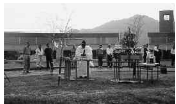
夏山登山の安全祈願