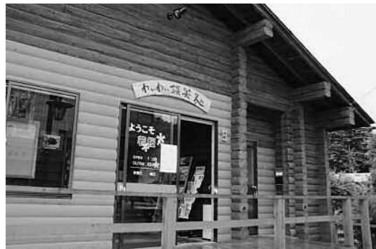
交流を深める場として活用される「わいわい談笑処」