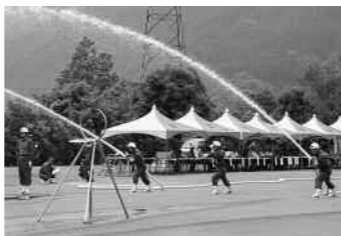
第2分団の競技の様子