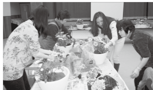
講師にコツを教わる受講生