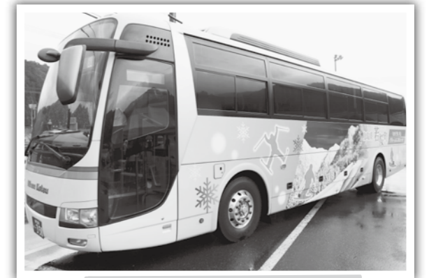
お披露目されたラッピング車両