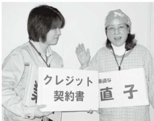
出前講座での寸劇

公民館での催し、婦人会、趣味の同好会などの集まりに、専門知識を持った講師を無料で派遣します。「最近の悪質商法」、「クーリング・オフ制度」を、寸劇や歌を交えながら楽しく学ぶことができます。希望がありましたらいつでもご相談ください。