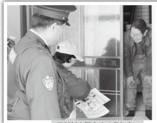
反射材を配布する参加者