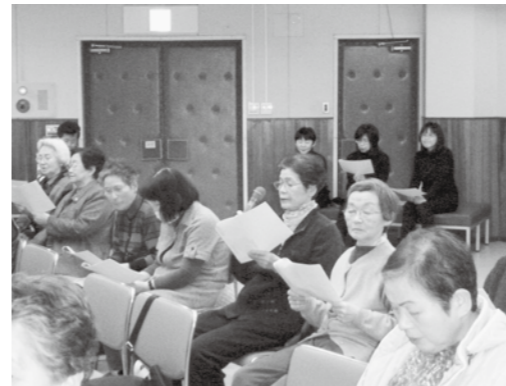
ピアノの伴奏にあわせて歌う受講生