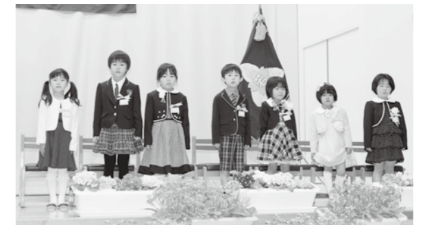
これからの学校生活にわくわく！