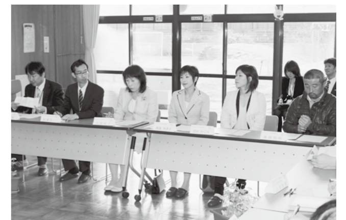
様々な提案が出された意見交換会