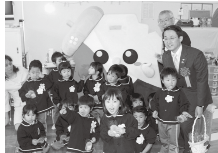
せんべいをもって大はしゃぎの園児たち

にせんべいを配るなど、セレモニーを盛り上げました。 セレモニー終了後には、知事を交え、町長や子ども園保護者などの意見交換会を行いました。保護者からは、普段はなかなか伝えられない現役子育て家庭ならではの思いや意見を知事や町長に投げかけており、様々な意見が提案されました。 当日は、あいにくの雨で、予定していたイベントを一部省略して実施しましたが、子どもたちは笑顔でセレモニーを楽しんでいました。