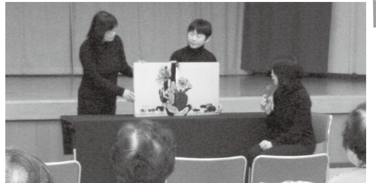
「もこもこ」による大型絵本の読み聞かせ