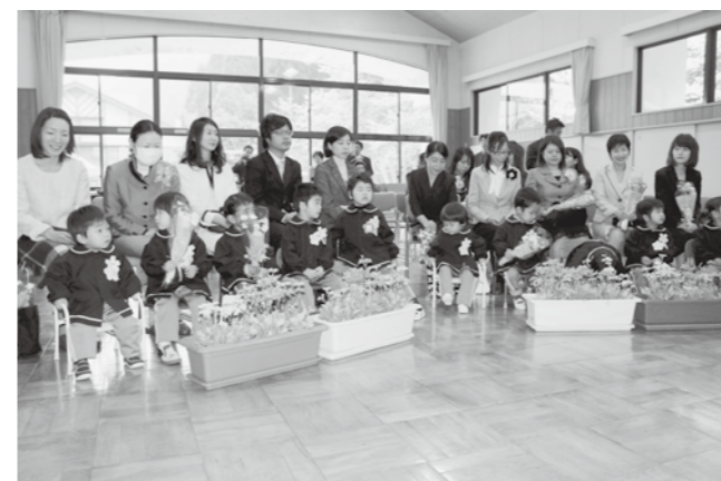
わかさ子ども園入園式