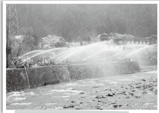
旧森林組合前での一斉放水