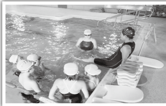
背泳ぎのバタ足を教わる子どもたち