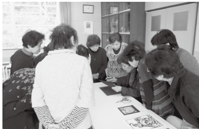
コツを教わる受講生