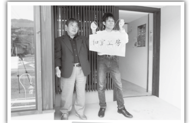
和宝工房オープン