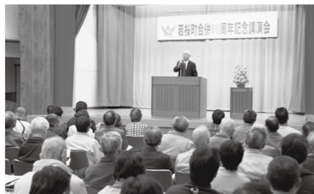
合併60周年記念講演会