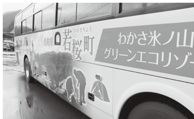
ラッピングバス車両