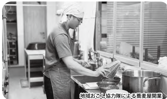
地域おこし協力隊による蕎麦屋開業