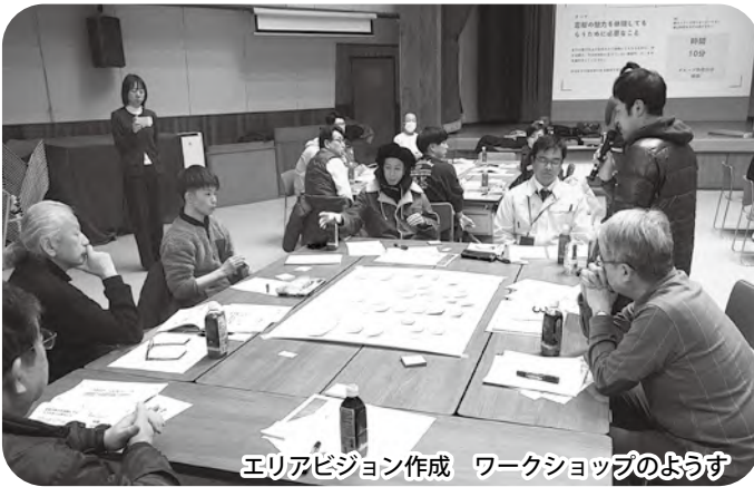
エリアビジョン作成 ワークショップのようす

NIPPONIA（ニッポニア）事業で令和7年に作成したエリアビジョンを踏まえた物件調査と、事業の計画策定に、国の有利な補助金を活用するため、前倒しし、(株)NOTEへの委託料として予算化したもの。