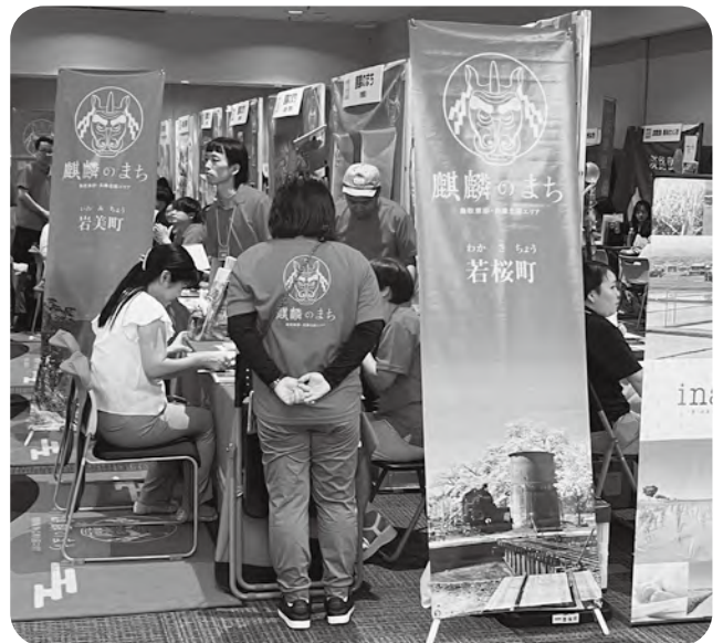
大阪で開催された移住フェアのようす

移住者の増加に向け て、より効果上がる 相談体制や情報発信の 仕方等を検討します。