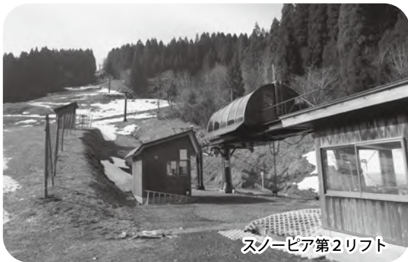
スノーピア第2リフト

わかさ氷ノ山スキー場の管理運営を円滑に進めるため、リフト整備工事、圧雪車の修繕等を行う。