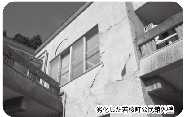
劣化した若桜町公民館外壁

地域の身近な生涯学習の拠点として、町民の利用しやすい環境を整備するため、若桜町公民館の外壁改修工事等を行い、適正な管理運営を行う。