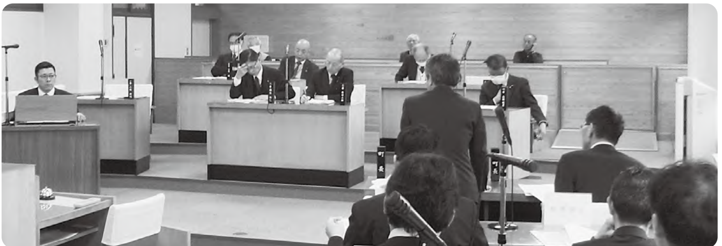
3月議会 定例会 一般質問のようす

共交通にかかる経費・産業の振興・雇用の確保・個人商店の維持」などについて、皆さんと一緒に考える時がきています。 議会は今期より定数が八議席となり、皆様からの付託に応じる議会、魅力ある議会、関心を持ついただける議会、ともに活動する議会とはどうあるべきか、改めて検討すべき時期です。 課題を共有し「安心・安全・快適」を共感できるよう議論が重ねられる町になるよう取り組んでいきます。 町を動かすのは皆様の声です。皆様と共に住みやすい町を創っていきたく強く思っています。