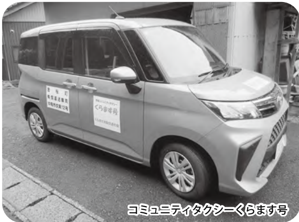
コミュニティタクシーくらます号

高齢者や通学者など交通弱者の移動手段確保を基本に、効率的かつ持続可能な運行体制を図り、住民及び観光客の周遊インフラを確立するためのバス運行、車両の維持管理を行う。