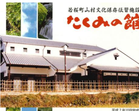
開館当時のリーフレット

今回はこれまでの企画展を中心に30年の歩みを振り返ります。企画展のポスター・チラシ及び所蔵作品、企画展の記録アルバム、三百田氏住宅で開催したイベントの記録写真などを展示します。