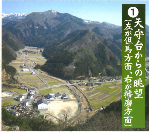
① 天守台からの眺望 (左が但馬方面、右が播磨方面)