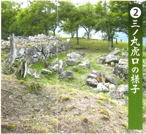
② 三ノ丸虎口の様子