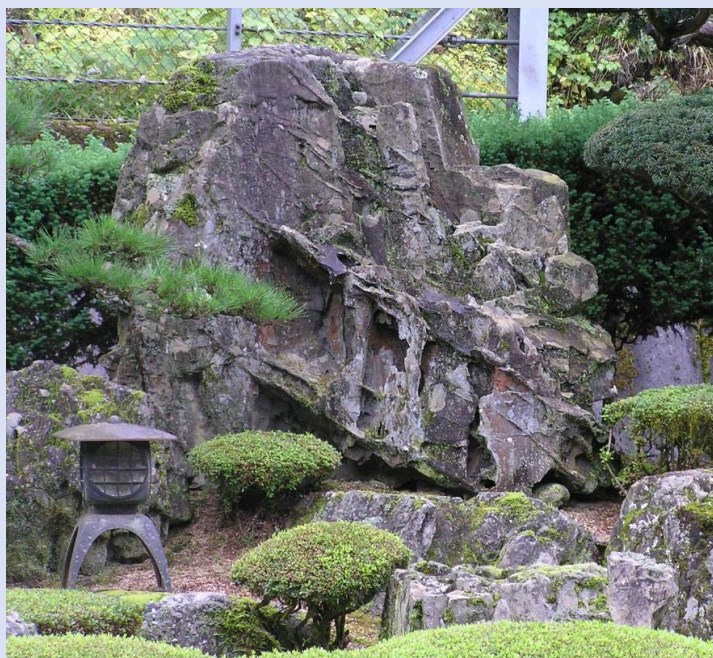
三倉石庭園(個人宅)