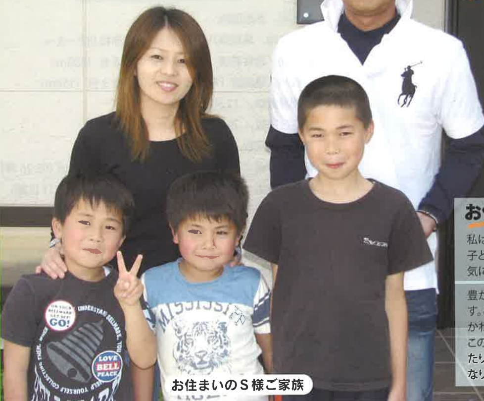
お住まいのS様ご家族

住宅建設の際、若桜町産材利用で最大 60万円 の補助金があります。 (20m 3 の県産材利用で40万円)